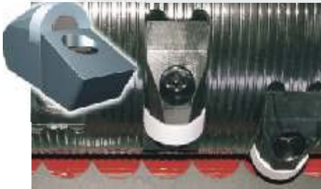
Konkave-Schneidkronen sind bis zu 4-mal wendbar

Die konkav geschliffenen Rundschneidkronen ermöglichen einen sehr hohen Durchsatz bei sehr geringem Kraftaufwand durch einen effizienten Scherenschnitt. Die auf dem Rotor montierten Messer können bis zu 8-mal mit wenigen Handgriffen gedreht und gewendet werden, bis ein Wechsel notwendig wird.